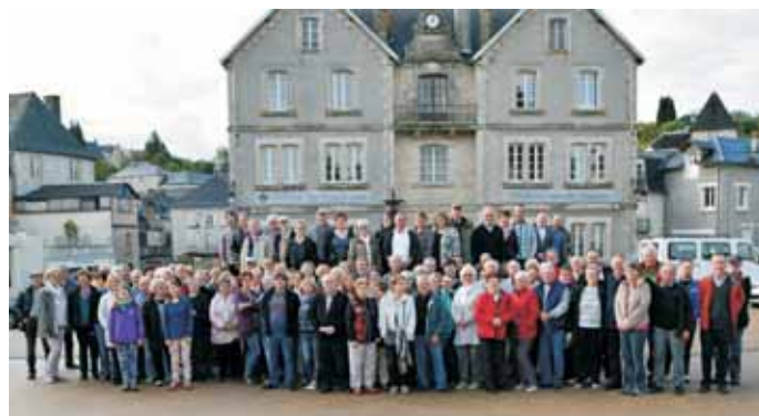
Gruppenbild mit Gastgebern

Ganz im Zeichen des Jubiläums stand für die Gemeinde Neuendettelsau das Treffen bei der französischen Partnergemeinde Treignac. Eine Gruppe von knapp 80 Personen machte sich mit zwei Bussen auf die Reise. Der Chor der Laurentius Kantorei begleitete die Kommune schon zum zweiten Mal als musikalischer Botschafter ins Limousin. Sie boten anlässlich der 30-jährigen Partnerschaft von St. Robert/Oberreichenbach ein Konzert und ein weiteres in Treignac. Vor mittlerweile 20 Jahren wurde die Jumelage offiziell besiegelt. Die eigentlichen Begründer dieser Partnerschaft sind das Collège in Treignac und die Realschule Neuendettelsau. Mit den Schulen fing alles an! Aus dem Schüleraustausch entstand eine Kommunalpartnerschaft zwischen den beiden Gemeinden. Geleitet und mitgetragen wird die Verbindung hauptverantwortlich von den Bürgermeistern und den Vorsitzenden der Partnerschaftskomitees. Auf der französischen Seite von dem derzeitigen Bürgermeister Gerard Coignac und seinen Amtsvorgängern Jean Paul Navaud, Georges Bordes und Guy Merle. Für das Comité de Jumelage steht seit vielen Jahren Gilbert Auberty an der Spitze. Seine Amtsvorgänger waren Daniel Borzeix und Marc Orlanges. In Neuendettelsau setzt Bürgermeister Gerhard Korn die erfolgreiche Arbeit seiner Amtsvorgänger Hans-Werner Landschuter und Klaus Klenner fort. Klaus Klenner füllt bereits seit 1998 den Posten des 1. Vorsitzenden des Freundeskreises