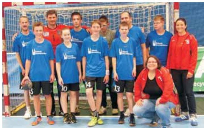
Das Neuendettelsauer Handballteam freute sich über den Austausch mit berühmten Spielern, wie dem deutschen Nationaltorhüter Henning Fritz.